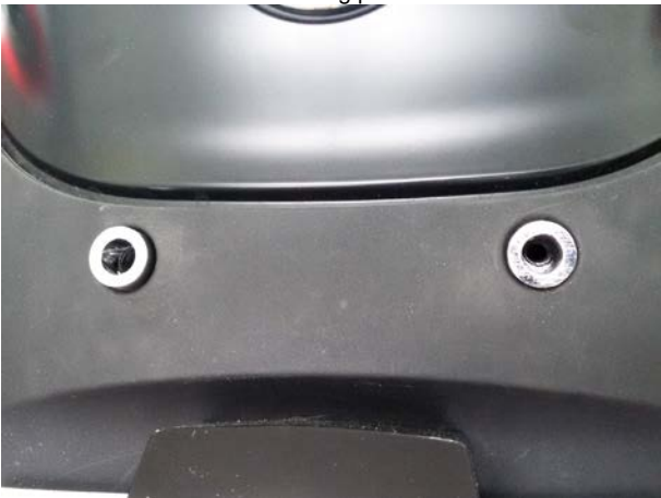
Mounting pic 2