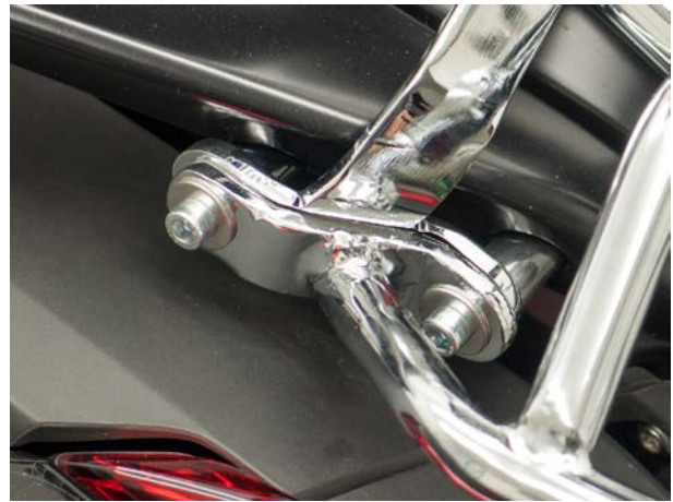
Mounting pic 1A