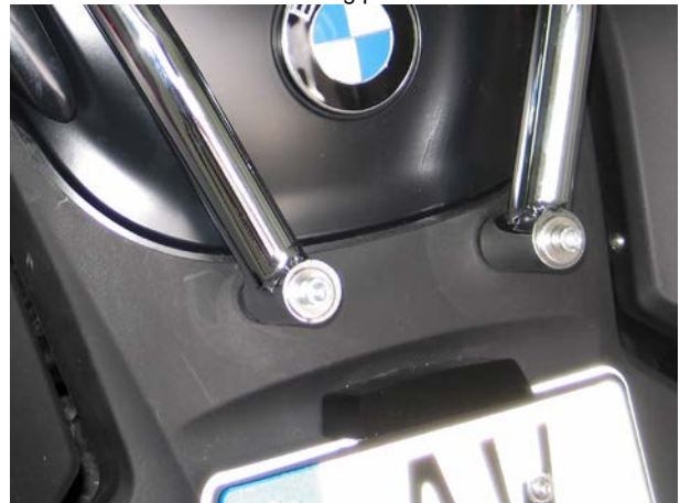
Mounting pic 2A