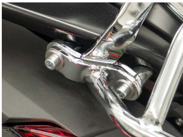
Mounting pic 1A