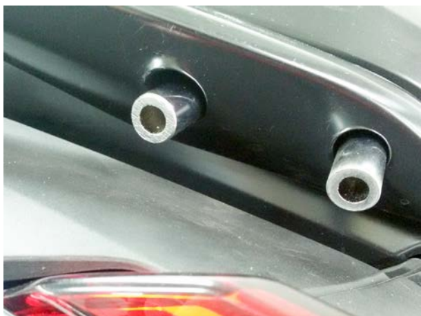
Mounting pic 1